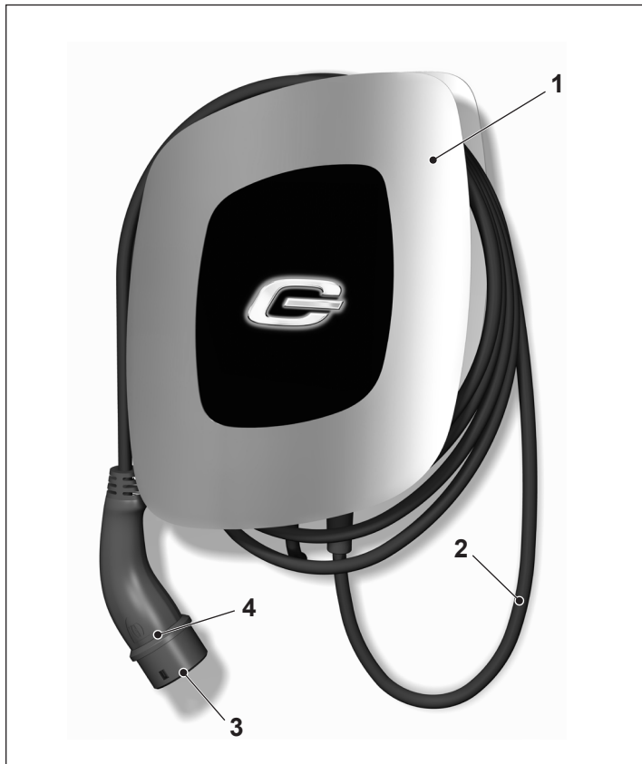
Abbildung 1: Ladesystem

Schutzeinrichtungen sind die folgenden Bestandteile: